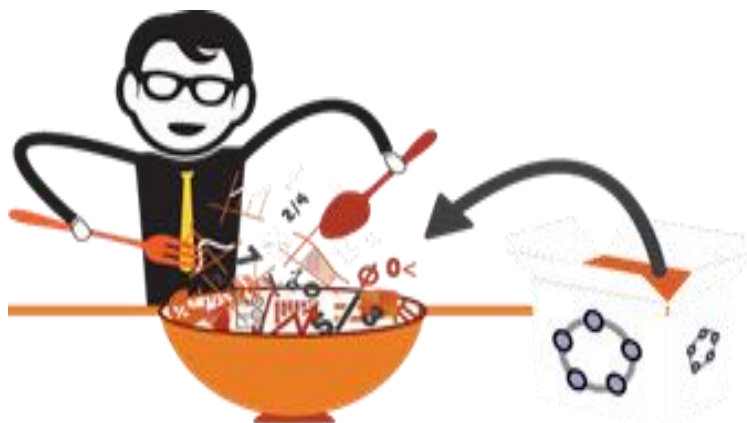
Figura 03 – sopa de conhecimentos

Através da utilização do Geogebra , os alunos aprenderam como inserir equações e coordenadas diretamente nos gráficos, explorar, construir e classificar as figuras poligonais, achando os vetores e pontos, construindo triângulos e resolvendo contas, dentre outros como exposto na Figura 03 “sopa de conhecimento” a parti do “Geogebra” eles aplicaram todos seus conhecimentos adquiridos basta serem criativos e trabalhar o método construcionista.