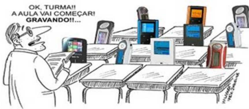
Figura 01 – tecnologia substituindo o caderno

Durante o processo instrucionista, o aluno perde sua autonomia de trabalhar seus conhecimentos conceituais, procedimentais e atitudinais com tanta frequência, pois para que o mesmo seja o mediador de seu conhecimento, é preciso que sua condição em determinado ambiente seja observada (Morin, 2002).