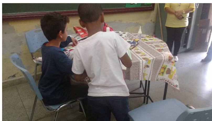
Figura 03 – Oficina 02