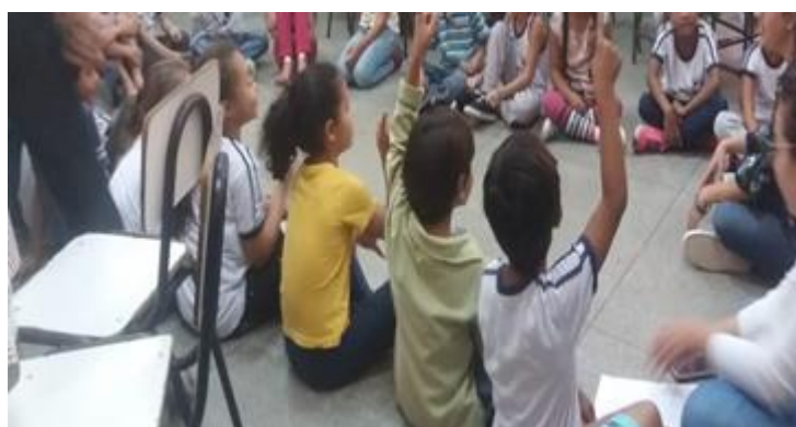
Figura 01 – oficina 01

Nesta oficina buscou-se compreender o que as crianças das turmas do 2º/3º ano do Ensino Fundamental – tendo entre sete e oito anos de idade - pensam sobre “dinheiro”. Sentamos, todos, em círculo no chão da sala, local no qual tecemos, juntos, os fios de uma conversa que perpassou a temática da oficina.