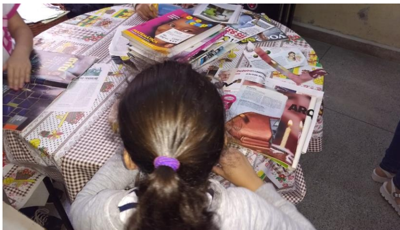
Figura 04 – Oficina 02