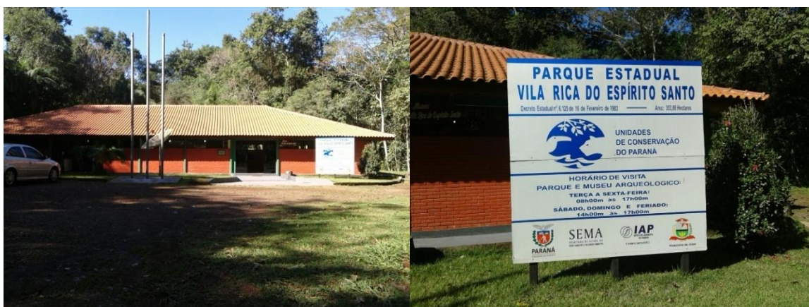
Figura 2: Sede do Parque Estadual Vila Rica do Espírito Santo.

O Parque Estadual Vila Rica do Espírito Santo em 17 de janeiro de 1948 foi caracterizado como reserva do Patrimônio Histórico e Florestal do Estado por meio da Lei nº 33 que caracterizava mais nove áreas. A reserva foi criada pelo Decreto 6125 de 16/02/1983 que recebeu o nome Parque Estadual Vila Rica do Espírito Santo “Rubens Augusto de Andrade”