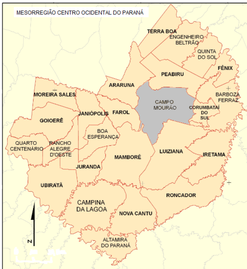
Figura 1: Campo Mourão en la Mesorregión Centro Occidental del Paraná

Se realizó también una entrevista semiestructurada con estudiantes de las cuatro carreras. Participaron en las entrevistas 10 jóvenes, 50% femenino y 50% masculinos, con equidad de género para que ambos sexos tuvieran la posibilidad de expresar sus criterios. En la misma se indagó sobre si consideraban que los medios económicos son los más importantes para alcanzar el desarrollo.