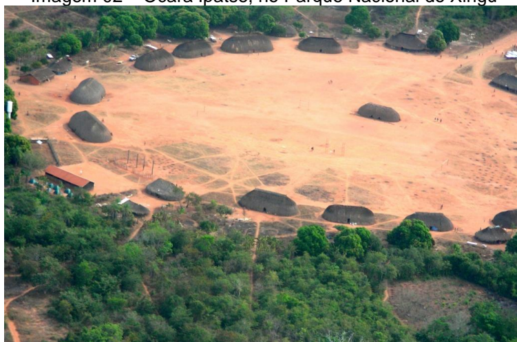
Imagem 02 – Ocara Ipatse, no Parque Nacional do Xingu

O topônimo Ocara é oriundo da linguagem nativa (indígena), cujo significado, em tupi-guarani, refere-se à praça ou ao terreiro central da aldeia/taça, com uma entrada e saída principais.