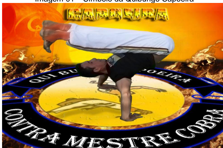
Imagem 01 – Símbolo da Quibungo Capoeira